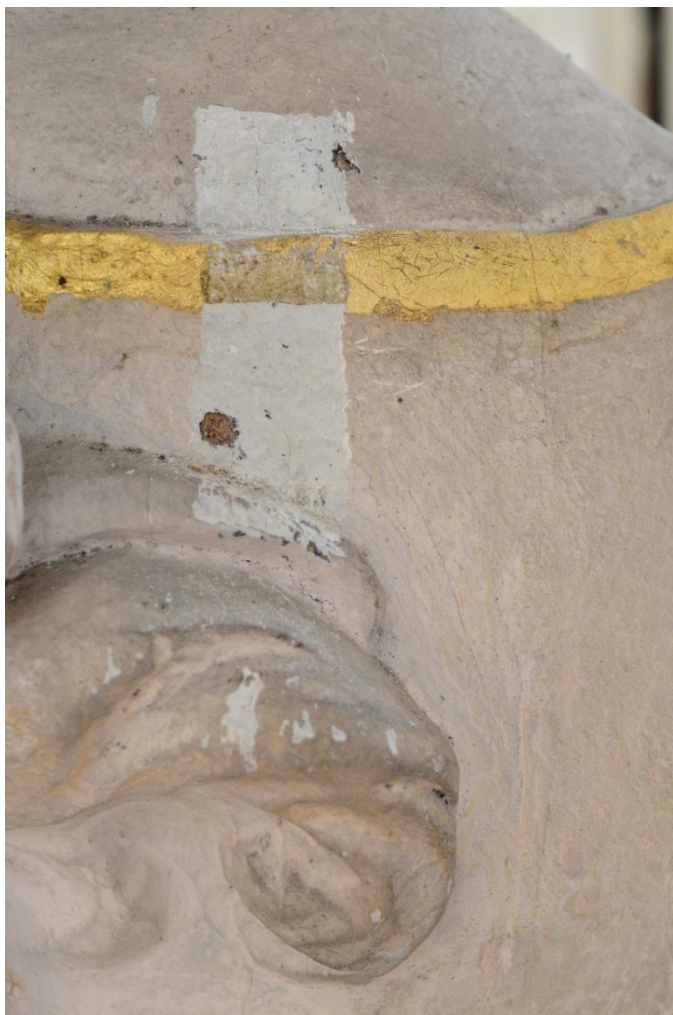
Stratigrafická sonda na starší vrstvu monochromie. Mladší vrstva kopíruje s drobnými přetahy starší provedení.