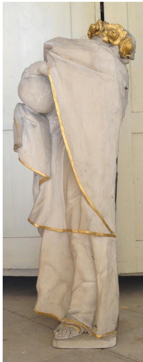
Socha sv. Rozálie z kostela Sv. Jakuba v Poličce.