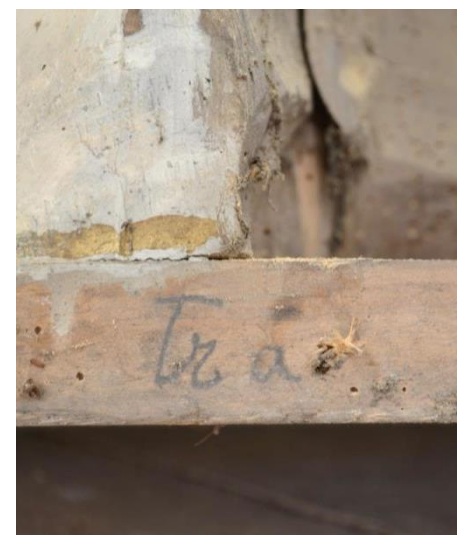
Nápis v soklové partii.